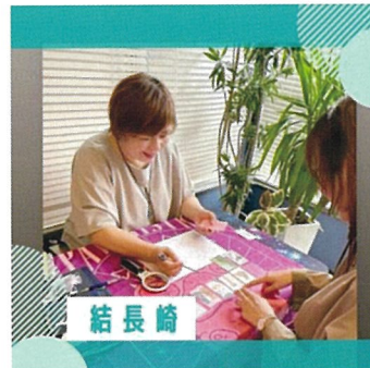
結長崎(占い・雑貨販売)