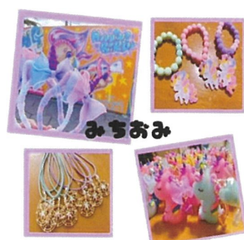
みちおみ(キッズ小物)