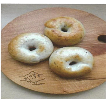
酒種酵母米粉パン とと