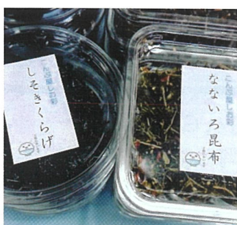
こんぶ屋 しお彩(海産物)