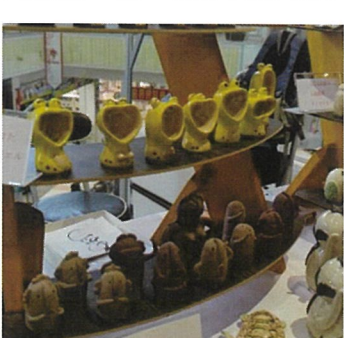
陶磁器工房一窯(陶器人形)