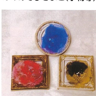
ぬのあそびきよこ(小物等)